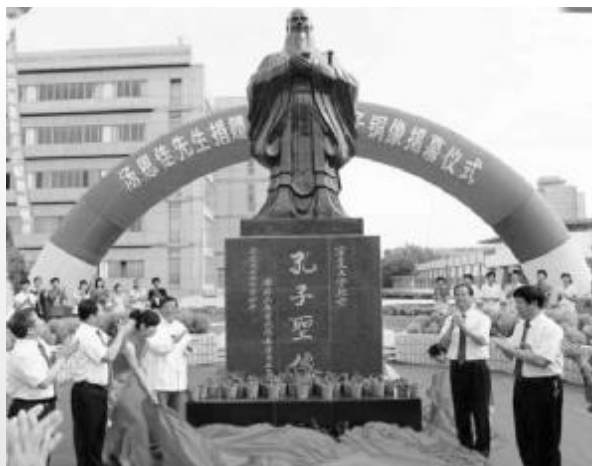
(曾华 / 文)

揭幕仪式结束后,汤恩佳博士为我校师生作了文化名人进校园第37场——儒家思想的社会价值学术报告。同时,我校聘任汤恩佳博士为客座教授,何建国校长为汤恩佳博士颁发了聘书。