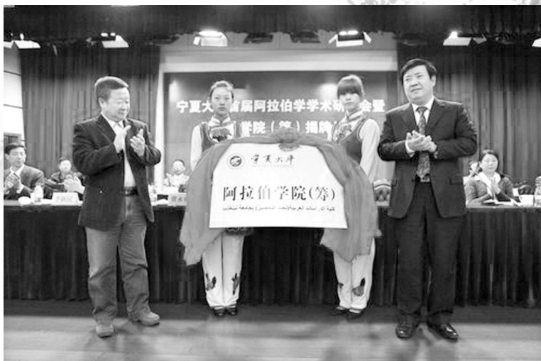
何建国校长(前排右一)和冀永强副厅长(前排左一)共同为宁夏大学阿拉伯学院(筹)揭牌

自治区教育厅副厅长冀永强,自治区财政厅副厅长马闽霞,我校党委书记齐岳、校长何建国、副校长谢应忠等及相关部门领导与北京语言大学、