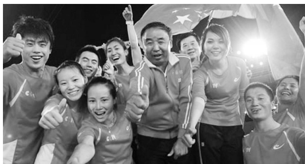
银川健儿合影留念

2011年2月28日晚,在宁夏广播电视总台演播厅隆重举行了“巨元地产”感动宁夏2010年度人物颁奖盛典。我校学生为主组成的《城市之间》银川代表队获得“感动宁夏”集体称号,自治区党委副书记于革胜为银川代表队授奖。颁奖辞是“胸前是国旗,背后是家乡。展示宁夏形象最好的外交官,彰显银川精神最酷的新名片。”